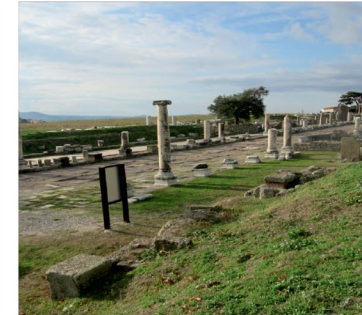
Ölümün Giremediği Hastane

Bronz bir plaka üzerinde kabartma olarak yapılmış kulak betimlemesi bulunmaktadır. Kulak tasvirinin üzeri altın ile kaplanmıştır. Altta üç sıra yazı bulunmaktadır. Yazıda, "Phabias Sekounda (adlı kişinin bu adak levhasını) Kurtarıcı Asklepios'a adadı" yazmaktadır.