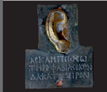
Asklepieion Kazılarında Ele Geçen ve Roma Dönemine Ait Adak Levhası

Galenos zamanında Bergama Asklepieion'una gelen hastanın tedavi edilememesi üzerine tapınağın giriş kapısının önüne çıkarılmasını ve akrabalarının almasını söylemiş. Kapının önüne bırakılan hasta, aynı kâseden içtikleri süte kusan iki yılan görmüş. Yılanlar sütun başında kavga yaparken süte zehirlerini saçmışlar. Ümitsiz hasta süt kâsesine yaklaşmış ve içmiş. Zehirli sütü içtikten sonra olduğu yerde uykuya dalan hastanın iyileşip ayağa kalkması üzerine Galenos, Asklepios'a (Sağlık Tanrısı) adak olarak üzerinde aynı kaptan içtikleri süte kusan iki yılan kabartmasının yer aldığı bir sütun diktirtmiştir.