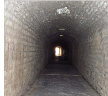
Eczacılığın Temellerinin Atıldığı Yer

Uyku odalarında hastaların istihare uykusuna yatırılması, su sesi, çamur kürü, şifalı su, hacamat, açlık tokluk kürleri, terapi ve müzik dinletisi gibi çeşitli yöntemlerle hastalıklar tedavi edilmeye çalışılmıştır. Antik dünyanın en önemli sağlık kentlerinden birisi olan Pergamon, eczacılığın babası olarak bilinen Hekim Galenos'un da memleketidir.