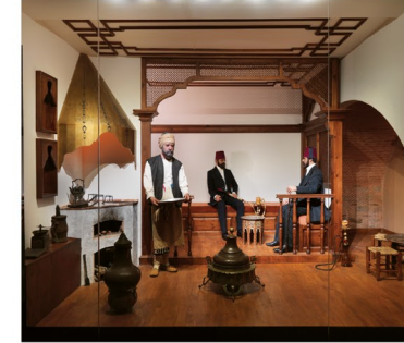
⑰ 19.Yüzyılda İstanbul; Etnografya Sergisi

Şam Evrakı koleksiyonu; İslam Sanatına ait en erken döneme tarihlendirilen parşümen üzerine yazılmış binlerce varaktan oluşan Kur'an sayfaları, rulo Kur'an-ı Kerimler, İslam cilt sanatının en eski örnekleri, İslami bilimlere ait bilgilerini yazıldığı sayfalar, Şam'ın sosyo-kültürel tarihini ilgilendiren onbinlerce belgeden oluşur. Koleksiyon, müzeye 1917 yılında getirilmiştir.