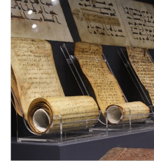
④ Şam Evrakları

Anadolu Selçukluları döneminin eşsiz örneklerinin yanı sıra, Osmanlı dönemine ait halı grupları müze koleksiyonunda olanca çeşitliliği ile temsil edilmektedir. 15. yüzyıla ait seccade ve hayvan figürlü halıların yanı sıra 15-17. yüzyılları arasında Anadolu'da üretilen ve Batı'da Halbein ve Lotto olarak bilinen halılar ile madalyonlu ve yıldızlı Uşak halılarından oluşan zengin bir halı çeşitliliği müzede sergilenmektedir.