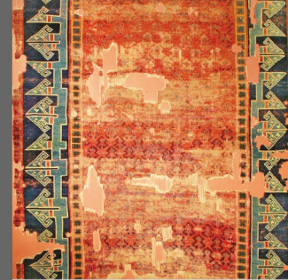
⑭ ⑮ Selçukludan Osmanlıya Halı Sanatı

Artuklulara ait olan eser iki kanatlıdır. Ahşap iskelet üzerine tunç plakalarla kaplanmış, pirinç çubuk ve levhalarla süslenmiştir. Her kanat üzerinde alt alta sıralanmış ve merkezinde oniki kollu bir yıldızın yer aldığı üç madalyon bulunmaktadır. Madalyonlar sonsuzluğu simgelemektedir. Ortada bir aslan başı ile birbirine bağlı iki ejderin oluşturduğu kapı tokmakları, kapının üstünde ise, süslü hatla yazılmış bronz döküm kabartmalı kitabe mevcuttur.