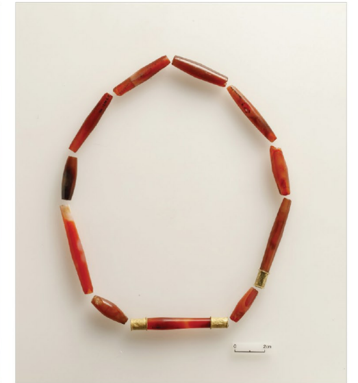
Altın ve Akikten Kolye Eski Tunç Çağı