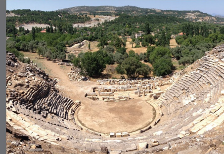
Mağrur Gladyatörlerin Ebedi İstirahatgahı

Roma İmparatorluğunda "beş iyi imparator" dönemi olarak bilinen zamanda Hadrianus'tan sonra başa geçmiş ve barışçıl bir hüküm sürmüştür. Dindar tavrı, kindar olmaması ve ağırbaşlılığı sayesinde senato tarafından latince "sorumluluk sahibi, itaatkar" anlamına gelen Pius lakabı verilmiştir.