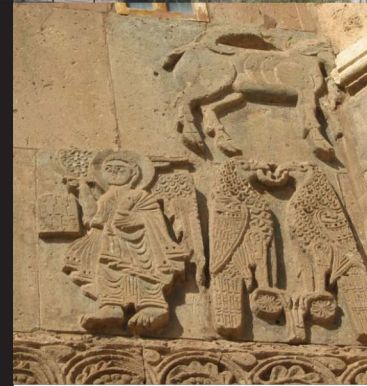
Dış Cephe Süslemeleri

Önemli tarihi ve turistik merkezler barındıran Van'ın önemli merkezlerden biri hiç şüphesiz Akdamar Adası ve Kutsal Haç Kilisesi'dir. Akdamar Adasında yer alan Kilise taşıdığı mimari özellikler sayesinde Ortadoks Ermeni Kiliseleri arasında farklı bir öneme sahiptir. Akdamar Adası ve Anıt Müzesi hem tarihi hem de içinde bulunduğu doğal güzellikler bakımından görülmeye değer yerler arasındadır. Vaspurakan Kralı I. Gagik tarafından 915-921 yılları arasında Keşiş Manuel'e yaptırılmıştır.