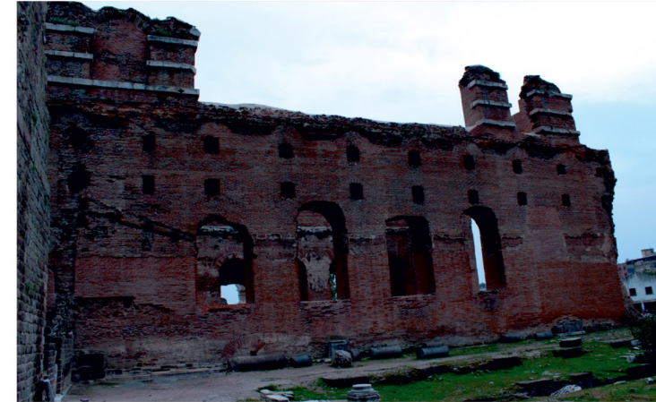
Mısır Tanrılarının Pergamon mimarisindeki izi..

Roma Dönemi'ne ait siyah mermerden baş, Kızılavlu (Bazilika) örenyerinden 1974 yılı kazılarında ele geçmiştir. Muhtemelen taşıyıcı figürlerden birine ait aslan başı olmalıdır.